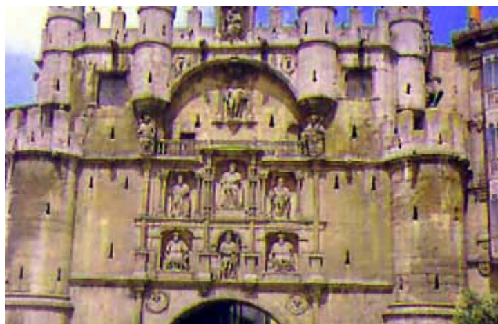
Puerta de Santa María

Era la puerta mas famosa de la ciudad. Su construcción data del siglo XIV y en el 1536 los arquitectos Francisco de Colonia , Juan de Vallejo y Cristóbal de Andino construyeron la nueva fachada que fue erigida en honor de Carlos V, y está flanqueada por dos torres rematadas por cuatro torrecillas.