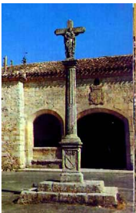
La Cartuja s

Situada a las afueras de la ciudad, fue fundada por Juan II en el siglo XV . En su interior destacan los sepulcros de los padres de Isabel la Católica, los reyes Don Juan y Doña María, obra de Gil de Siloé , y el retablo mayor. Cabe destacar, a su vez, la espléndida sillería del coro.