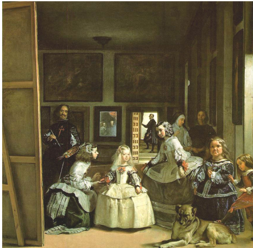
ORDEN DE SANTIAGO (Velázquez pertenecía a ella: cruz roja)